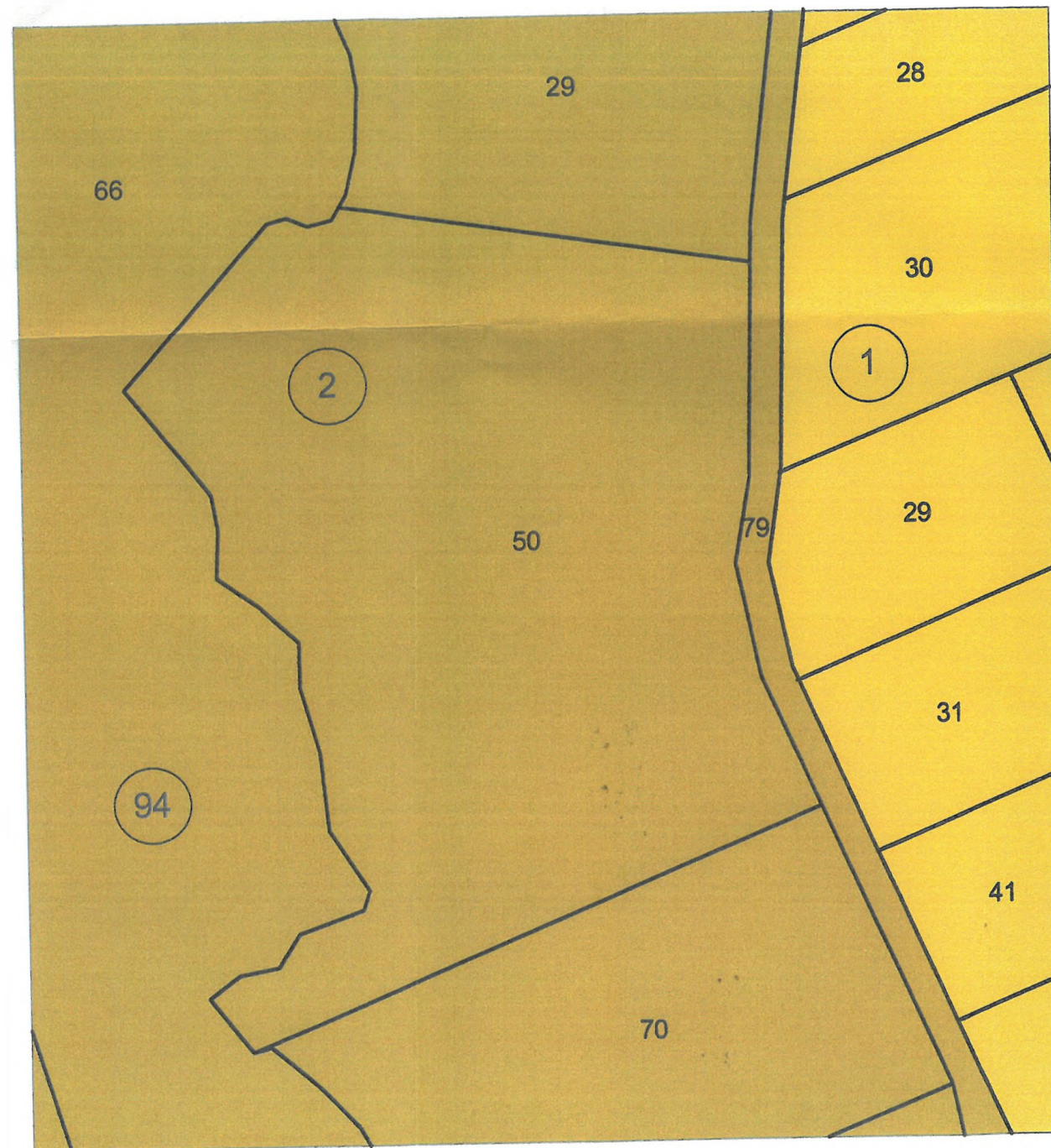
Извадка от ОУПО Севлиево за ПИ 73763.2.50 по КККР на с. Търхово М 1:1000