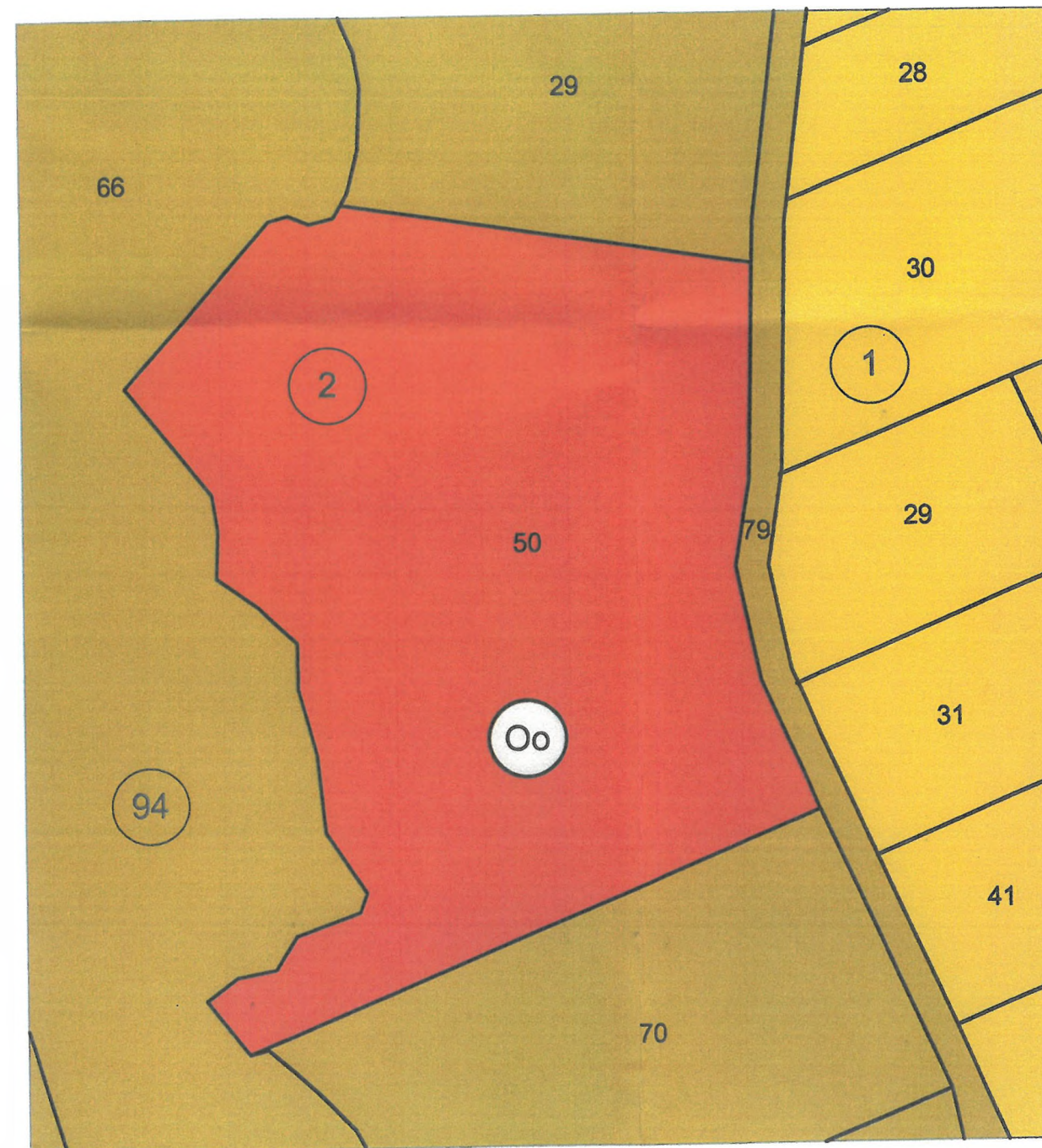
Проект за изменение на ОУПО Севлиево за ПИ 73763.2.50 по КККР на с. Търхово М 1:1000