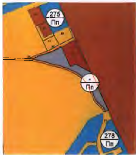
Сравнителен чертеж- предложение за частично изменение на действащия Общ устройствен план М 1: 5000