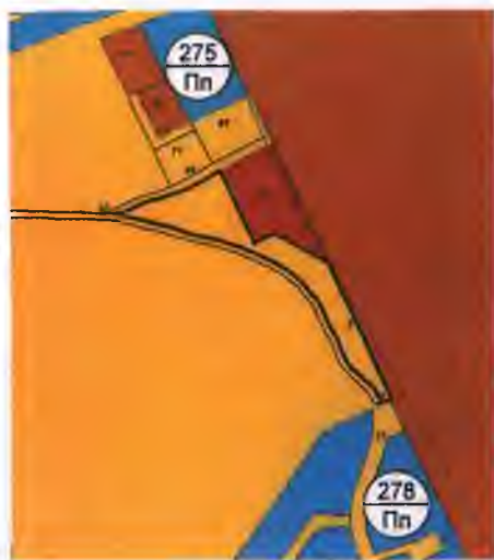
Сравнителен чертеж Извадка от действащия Общ устройствен план М 1: 5000