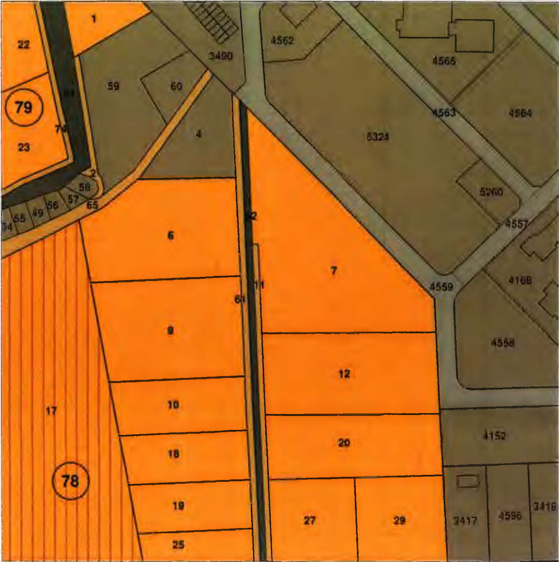
ОПОРЕН ПЛАН М 1:2000