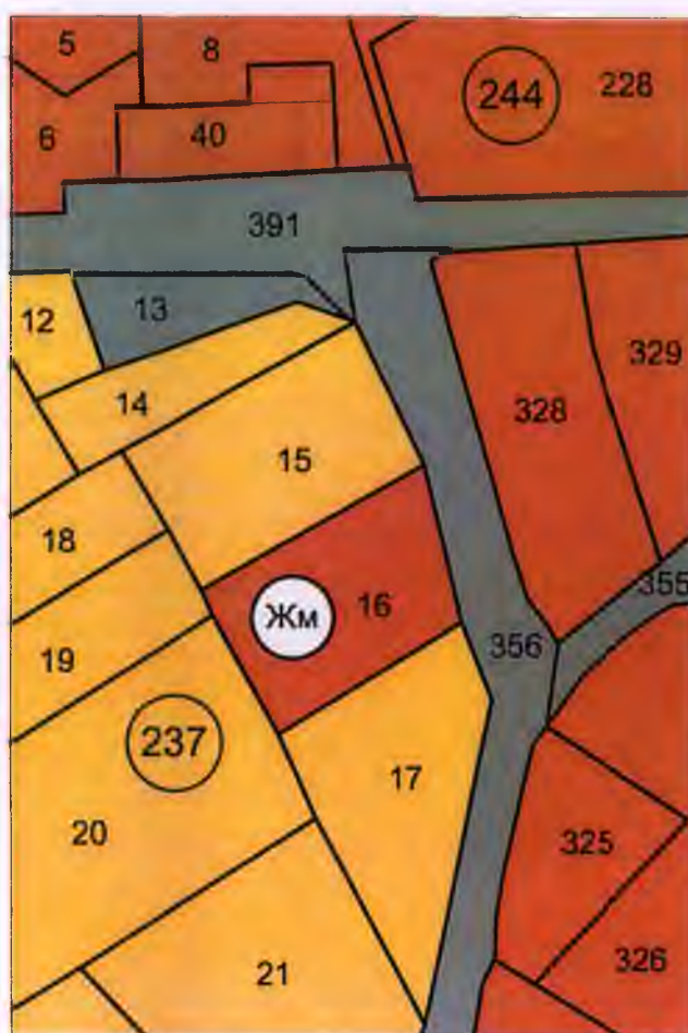
Предложение за изменение на ОУПО Севлиево за ПИ 40275.237.16 по КККР на с. Кръвеник М 1:1000